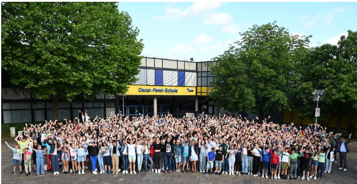
Unten: Erschließungstreppenhaus Neubau Oben: Verabschiedung vom alten Schulgebäude am Freitag, 8. Juli 2022

Am vergangenen Freitag haben auch wir uns im Rahmen einer Fotoaktion vom „alten Haus“ verabschiedet.